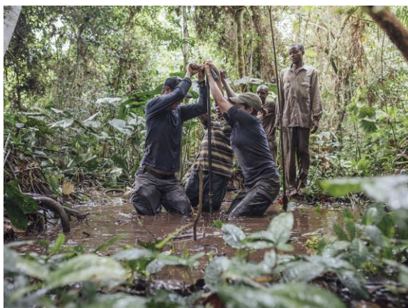
Des scientifiques ont découvert de vastes tourbières dans le Bassin du Congo.

La Cuvette centrale est une vaste zone de forêts et de marécages en plein cœur du bassin du Congo. Elle joue un rôle critique pour la biodiversité et le climat mondial, faisant partie intégrante de la deuxième plus vaste forêt humide tropicale du monde. En 2014, des scientifiques britanniques et congolais ont fait