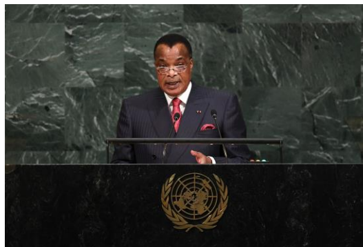
La famille présidentielle du Congo a fait l'objet d'une série de scandales.

Global Witness a également analysé les études sismiques et chimiques faites à Ngoki avant 2015 par le prédécesseur de PEPA, Pilatus Energy. Celles-ci sèment aussi un doute sur la crédibilité des propos du Congo relatifs à une découverte d'huile majeure, et plus spécifiquement au nombre annoncé de 359 millions de barils. Un géologue possédant une vaste expérience du secteur pétrolier a confié à Global Witness que d'après les travaux exploratoires réalisés à ce jour, il serait impossible d'affirmer avec certitude que le bassin renferme des quantités significatives de pétrole et de gaz. Les études – une étude sismique en 2D conjuguée aux résultats d'un puits d'exploration – sont tout