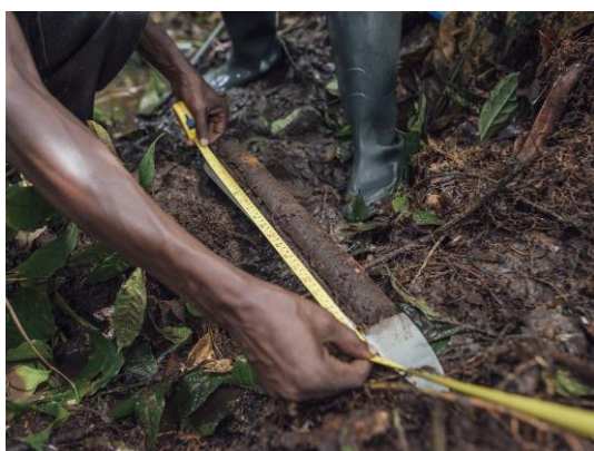
Les tourbières du Congo contiennent de larges stocks de carbone.